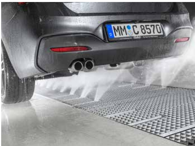
Lave châssis pivotant En option : extensible par segments