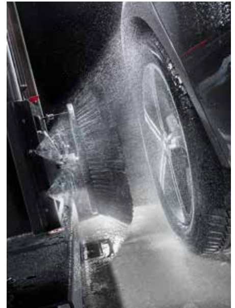
Système d'aspersion détergent pour jantes Élimination de la poussière de freinage En option : Mousse de jante