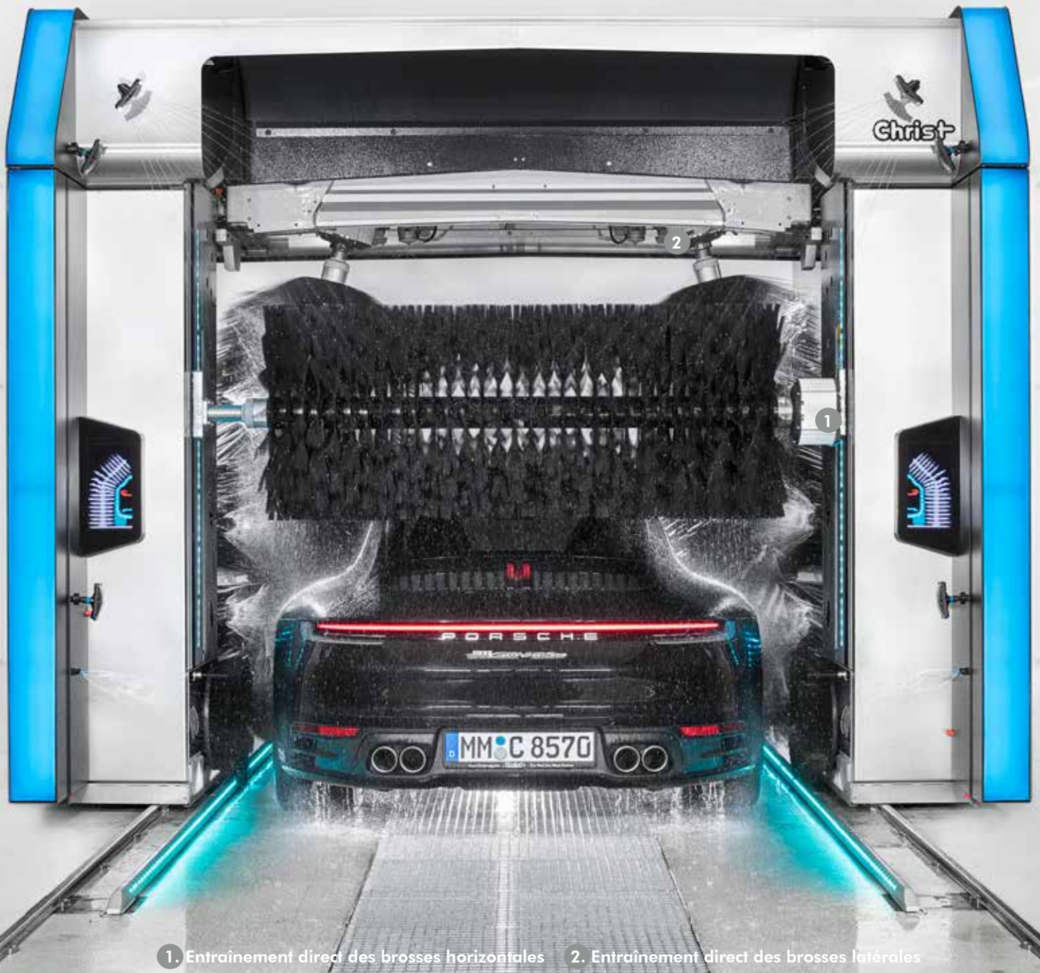
1. Entraînement direct des brosses horizontales 2. Entraînement direct des brosses latérales