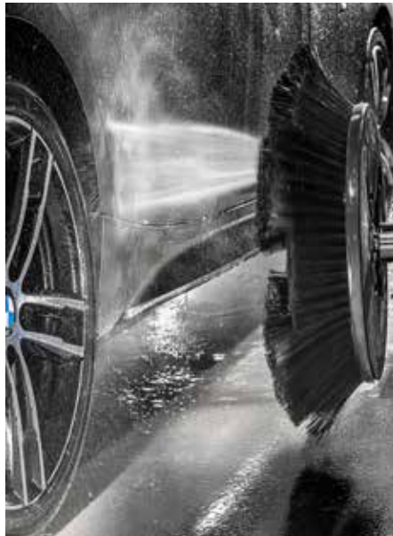
Laveur du bas de caisse et des roues haute pression Les principales saletés sont retirées