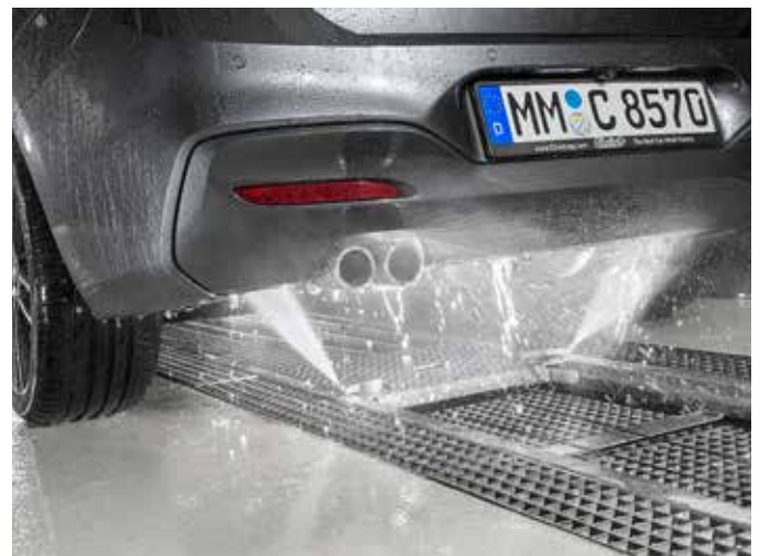
Laveur du dessous de caisse mobile Mesure de la longueur véhicule par scanner, faible consommation d'eau