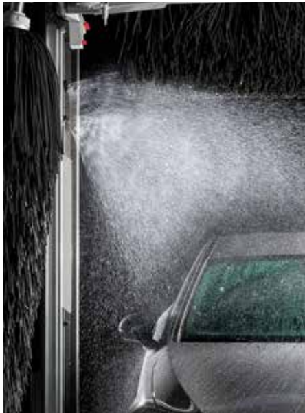
Chimie de saison Élimination des insectes