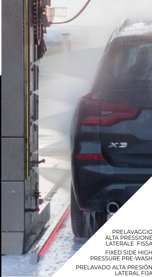
PRELAVAGGIO ALTA PRESSIONE LATERALE FISSA FIXED SIDE HIGH PRESSURE PRE-WASH PRELAVADO ALTA PRESIÓN LATERAL FIJA HAUTE PRESSION LATÉRALE FIXE