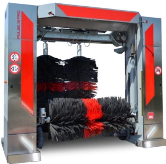
PULSE 1S PRO

Aujourd'hui, la gamme s'enrichit du précieux système d'éclairage LED Carbon, au design attrayant qui crée un grand charme pour le modèles.