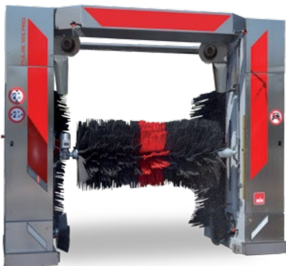
PULSE 1SE PRO