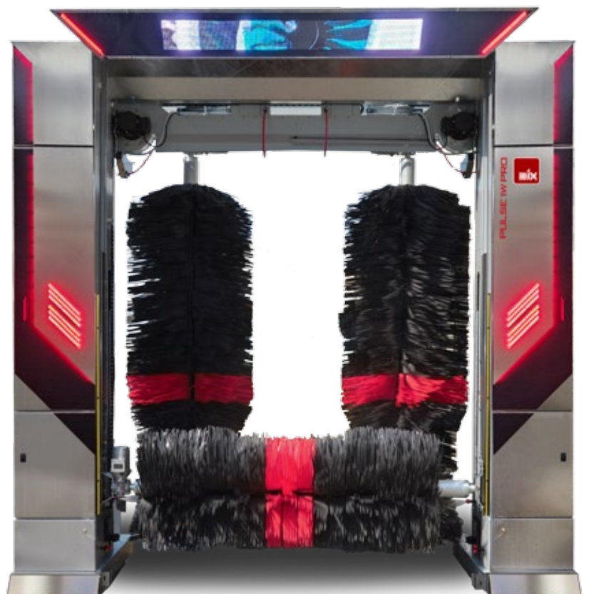
PULSE 1W PRO