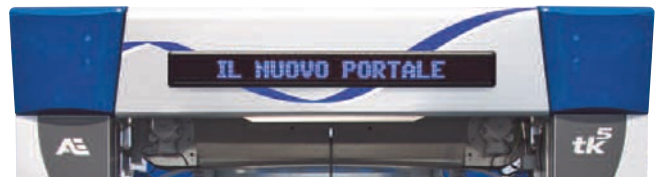
VISUAL · 020