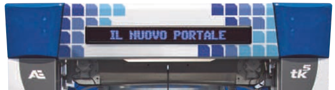
VISUAL · 010