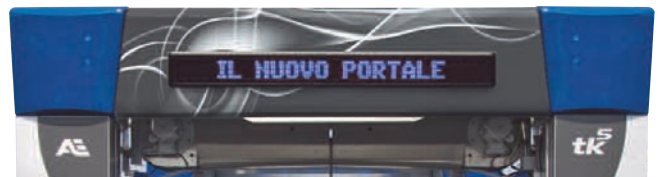
VISUAL · 040