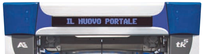
VISUAL · 030