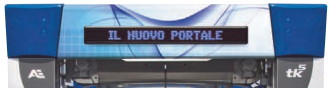
VISUAL · 050