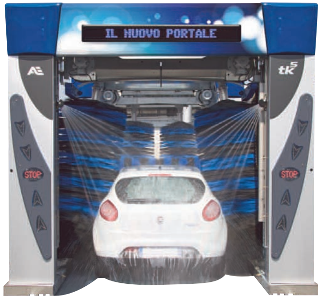
VISUAL · 060