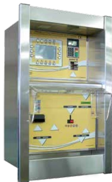
Self Service Top Line