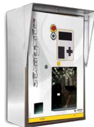
Self Service Standard