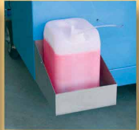
Supporto porta tanica detersivo (optional).

Start key with electric starting mechanism.