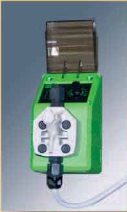
Dispositivo automatico detersivo.

Hydraulic traction with variable speed and extra large wheel.