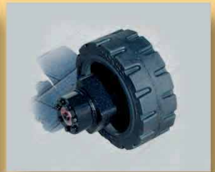
Trazione oleodinamica a velocità variabile con ruota maggiorata.

Hydraulic traction with variable speed and extra large wheel.