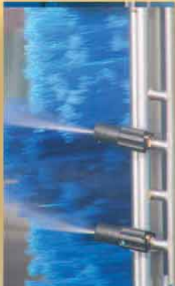
Ugelli a getto laminare.