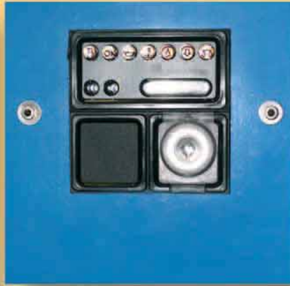
Chiave accensione con avviamento elettrico.

Start key with electric starting mechanism.