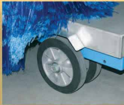
Ruote gemellate per maggiore stabilità.

Fullwash motor unit with high pressure pump