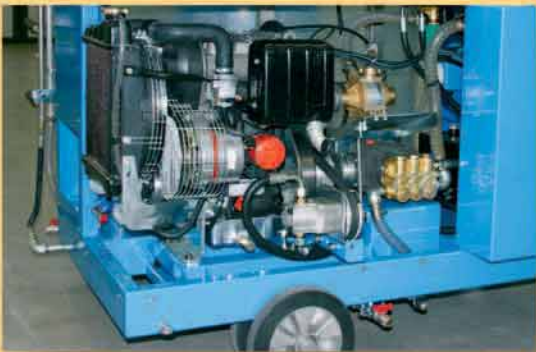
Gruppo motore serie Fullwash con pompa alta pressione

Fullwash motor unit with high pressure pump