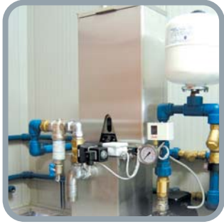
Dosatore polvere Washing powder doser Doseur poudre Pulverdosierer