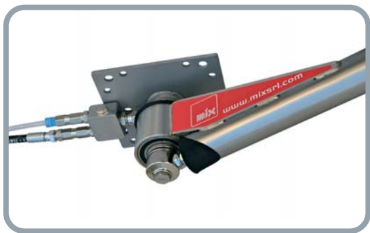
Particolare braccio doppio ingresso Detail of the Double-entrance arm Détail du bras double entrance Einzelheit von Doppeleingang Arm

The ideal solution for optimizing any available space, to build 2 to 6 bays self washing systems. Full stainless steel AISI 304 body with top quality electromechanical parts. Optional enhancements include remote control, remote management and electronic payment systems.