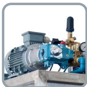
Particolare gruppo pompe Pump group detail Détail groupe pompes Einzelheit der Pumpeneinheit