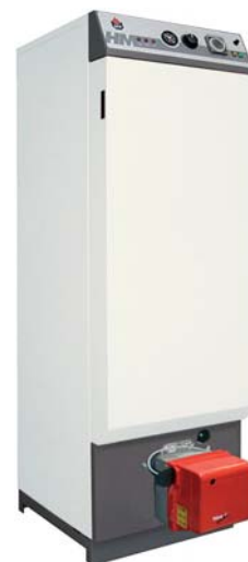
Caldaia Boiler Chaudière Einzelheit der Heizung