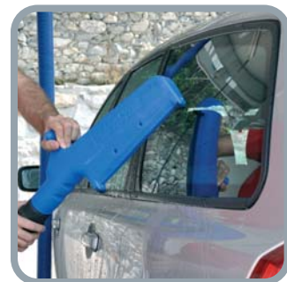
Sistema di asciugatura Drying system Système de séchage Trocknungssystem