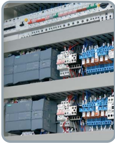
Particolare quadro elettrico Electric board detail Détail du tableau électrique Teilansicht Stromtafel

Composants électromécaniques et électroniques de très haute qualité et grande efficacité pour équiper le local technique avec des installations de lavage auto de grandes dimensions. Peut être personnalisé avec télécontrôle, télégestion et systèmes de paiement électronique. C'est la solution idéale pour réaliser des installations de autolavage self de 2 à 6 pistes (2-4 pour TOP COMPACT EVO).