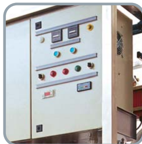
Particolare quadro elettrico Electric board detail Détail du tableau électrique Teilansicht Stromtafel